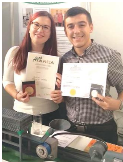
Stroj za automatsko sortiranje graha koji je zaslužio nagrade