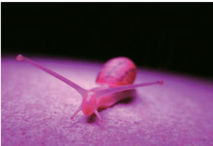
Fotografija Mare Vicelja