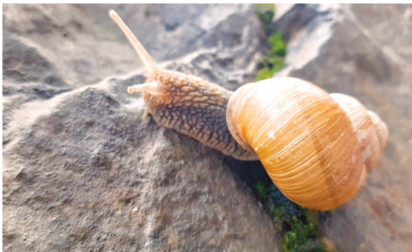
Fotografija Nikoline Boić