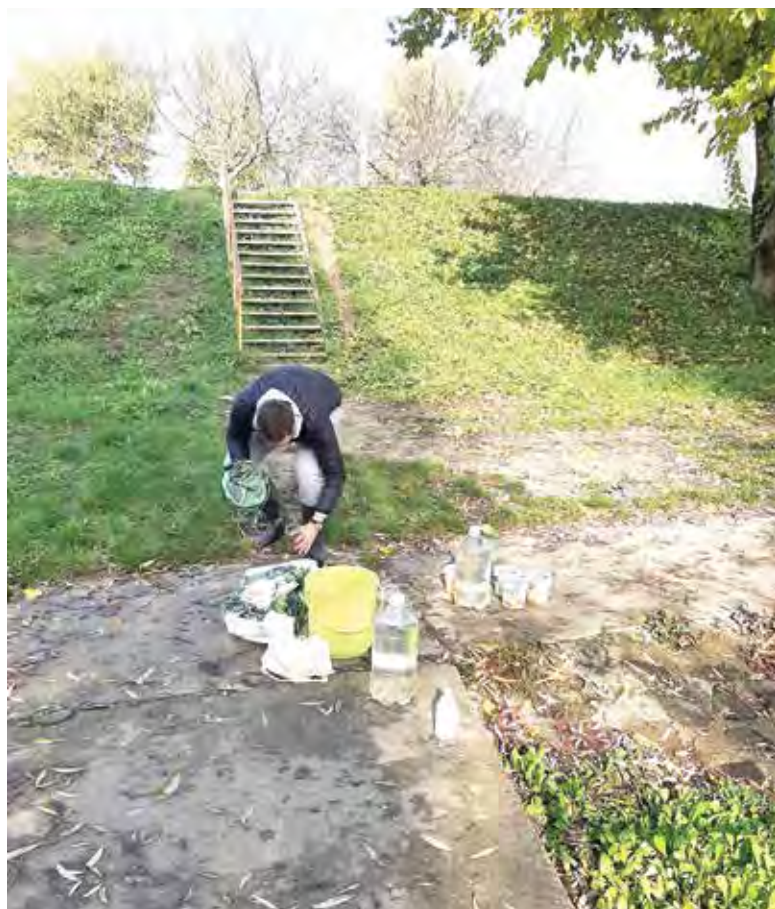
Uzorkovanje vode i sedimenta na području vodenih ekosustava u gradu Osijeku