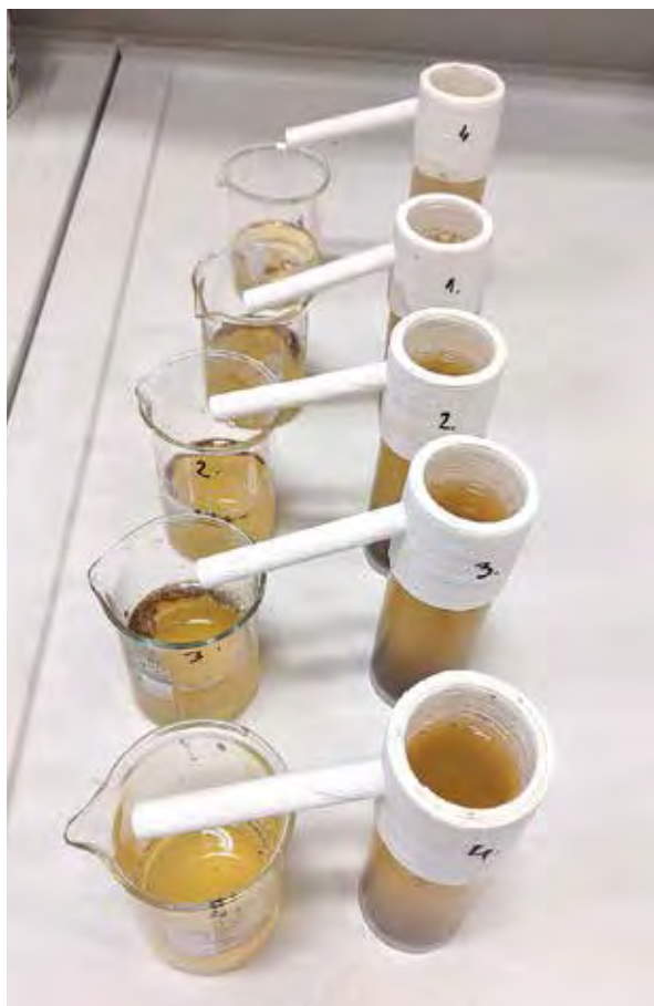
Izdvajanje mikroplastike iz sedimenta